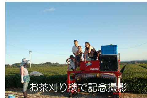
お茶刈り機で記念撮影

※洗濯機は屋外に設置しています。寝具のシーツ類は3泊につき1回換えをご用意します。