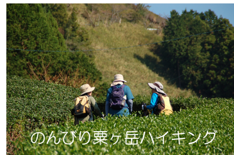
のんびり栗ヶ岳ハイキング